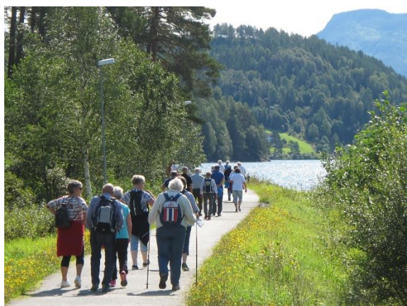
GS-veg mellom Dalaåi og Kviteseidbyen. Studietur 22.08.17.