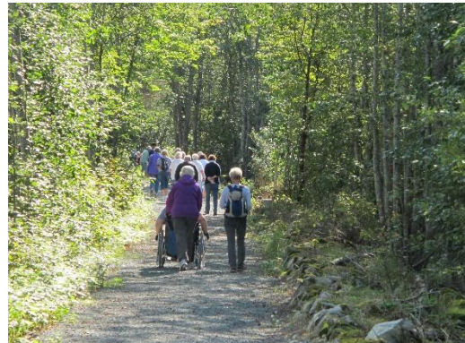
Fra v.: Fjellbrua i Hamaren aktivitetspark, tunnel på Gamle Drammensbanen og turveg langs Dalaåi nær Kviteseid sentrum.