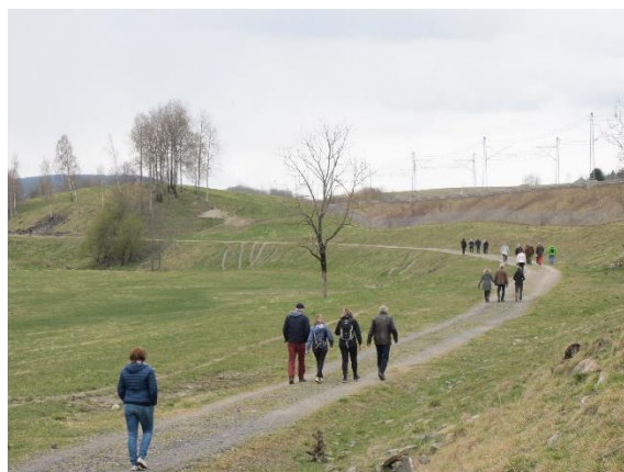
Turveg på gammelt togspor ved Galleberg, Sande i Vestfold. Studietur 27.04.17.